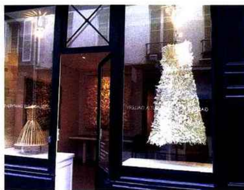
EXPOSITION « COUTURE ET CARTON ÉDITION#2 »